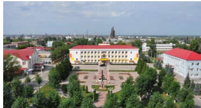
НКНПЗ - крупнейшее предприятие области