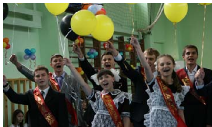
В школе №7 функционируют 2 «Роснефть»-класса