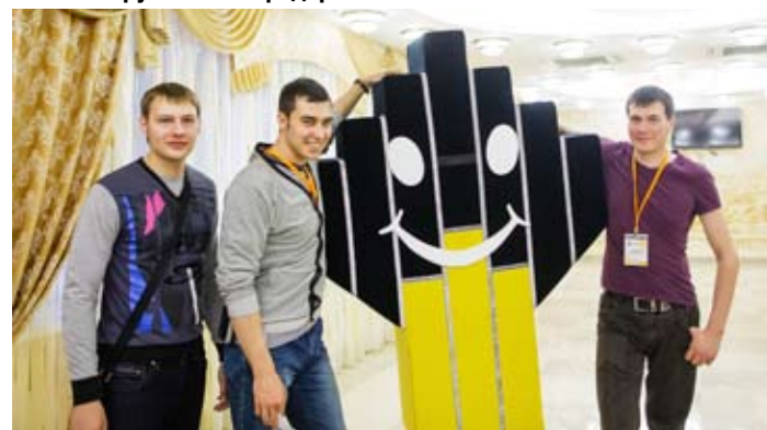
На конференции молодых специалистов НК «РОСНЕФТЬ»

временный офис. Они оборудованы комнатами приема пищи и оснащены современной мебелью и бытовой техникой. Удобно, особенно для работников ночных смен. По коллективному договору они обеспечиваются ночным питанием, которое доставляется прямо на рабочее место. Дневные работники тоже не в обиде. На территории завода работает пять столовых на 430 посадочных мест. Стоимость питания не превышает в среднем 80-90 рублей. А после трудовой смены работников ждут 15 бытовых комплексов на 3183 мест. Это не просто бытовки, а целые структуры отдыха, включающие душевые, помещения для сушки спецодежды и мойки обуви, бассейны и сауны, залы для переодевания с вместительными шкафчиками для одежды, комнаты отдыха.